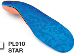
PL910 STAR Taglie: 22-47

PLANTARE BIOMECCANICO INDICATO PER PIEDE PIATTO DI I° E II° GRADO