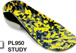
PL950 STUDY Taglie: 23-44

PLANTARE BIOMECCANICO INDICATO PER PIEDE PIATTO DI I° E II° GRADO