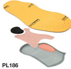
PL186 APORPIDIA KIT Taglie: 35-46