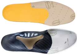
PL280 METAGOLD Taglie: 35-46

PLANTARE BIOMECCANICO INDICATO PER PIEDE PIATTO DI III° GRADO